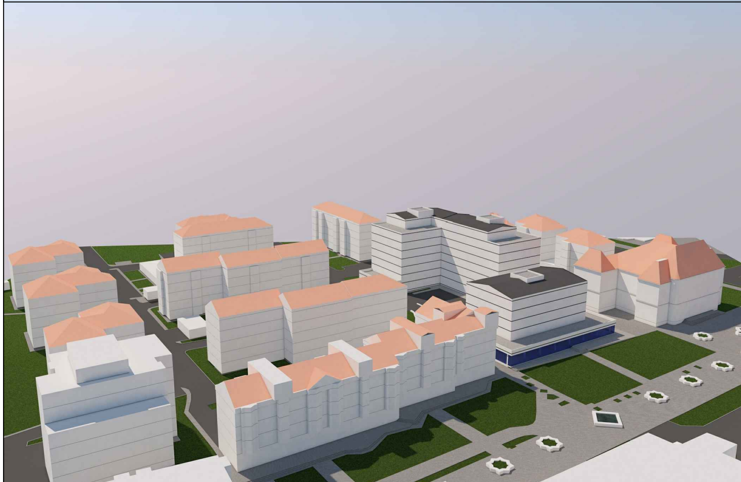
VEDERE DINSPRE PIETONALUL UNIRII