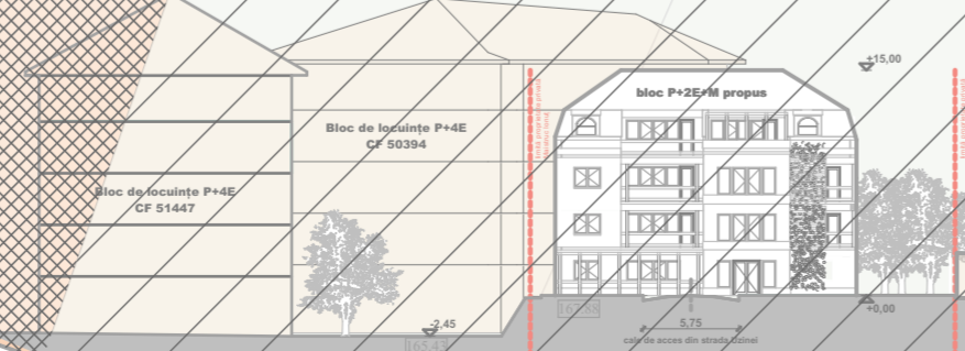
profil transversal S2 propus sc 1:500

acelerația terenului pentru proiectare perioada de control (colți) valoarea încărcării de zăpadă pe sol presiunea de referință a vântului categoria de importanță clasa de importanță și expunere la cutremur grupa a_0 = 0,20 \text{ g} (Cod de proiectare P100 - 1/2013) 0,7 \text{ sec} (Cod de proiectare P100 - 1/2013) S_0 \cdot K = 2,0 \text{ kN/m}^2 (CR1 - 1 - 3-2012) q_{ref} = 0,7 \text{ kN/m}^2 (CR1 - 1 - 4-2012) C - construcție de importanță normală (H.G.786/1997 Anexa 3) III - construcție de tip curent (P100 - 1/2013) A4