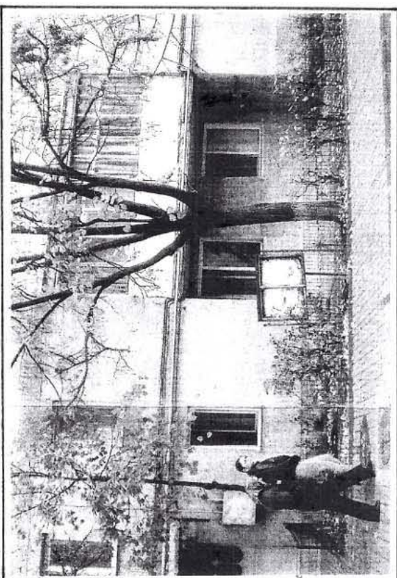
• VEDERE • • RELEVEE FOTOGRAFICE • • FATADA PRINCIPALA •