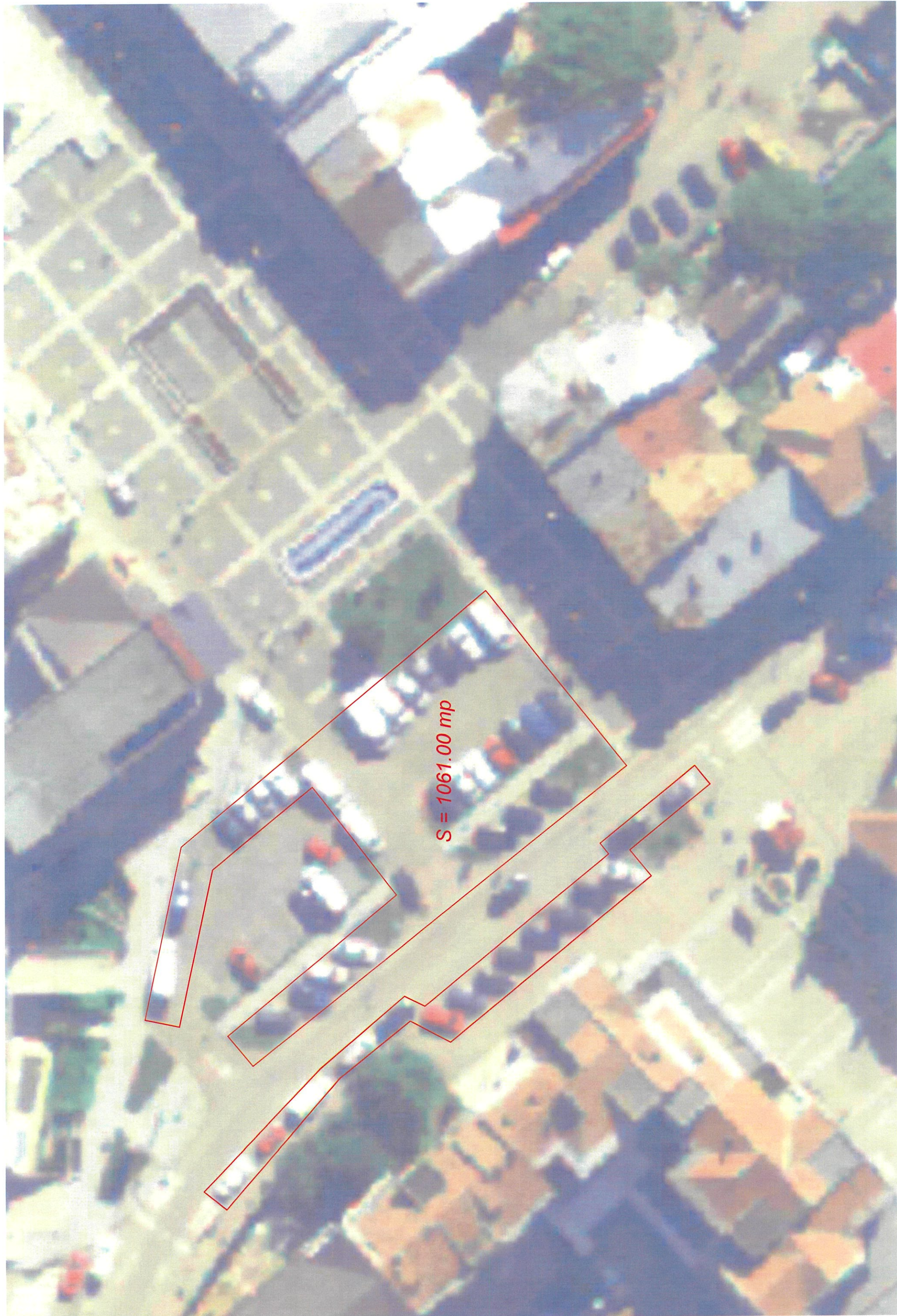
Victorie - MODAROKH