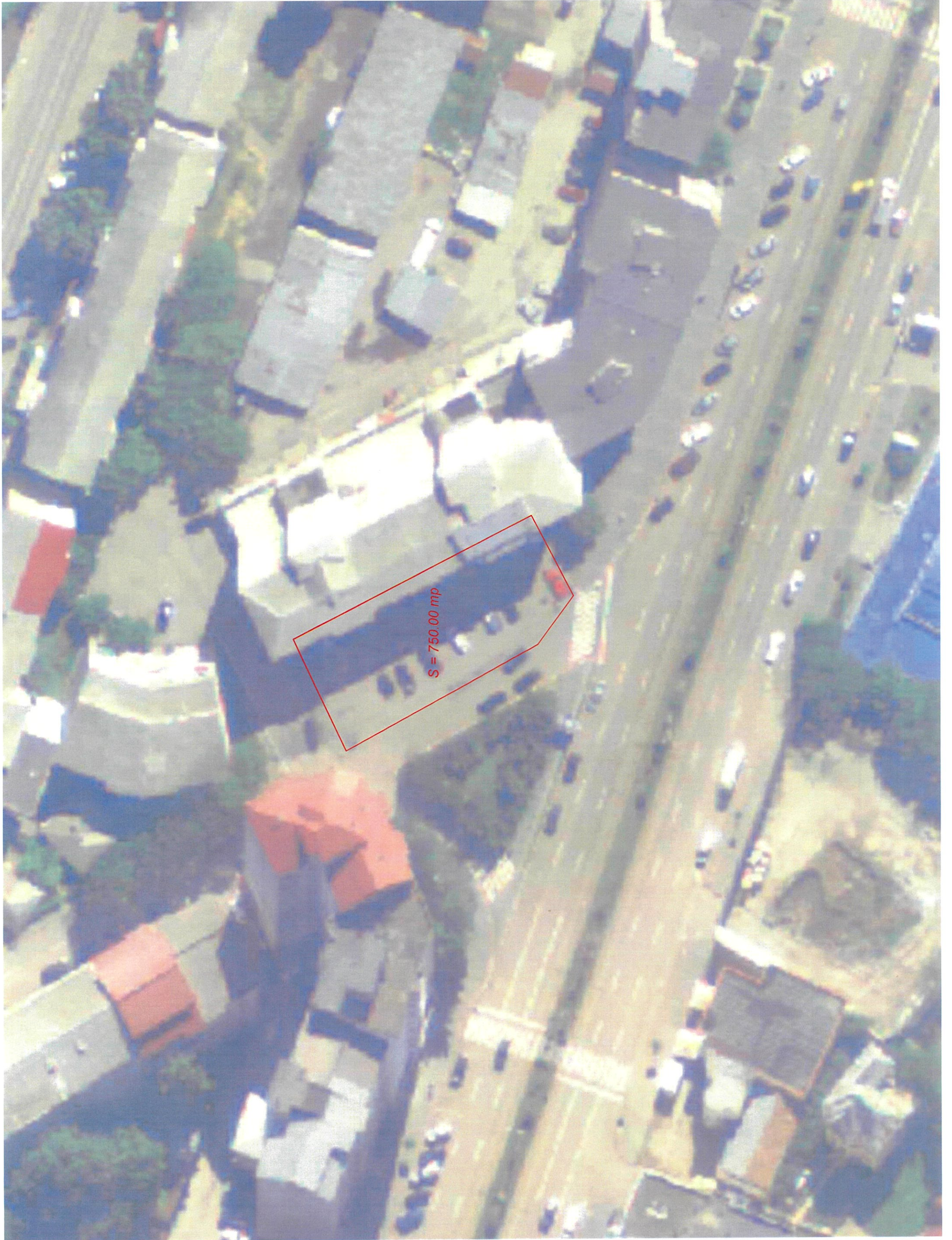
CALEA NAȚIONALĂ - ȘTEFAN CEL MARE