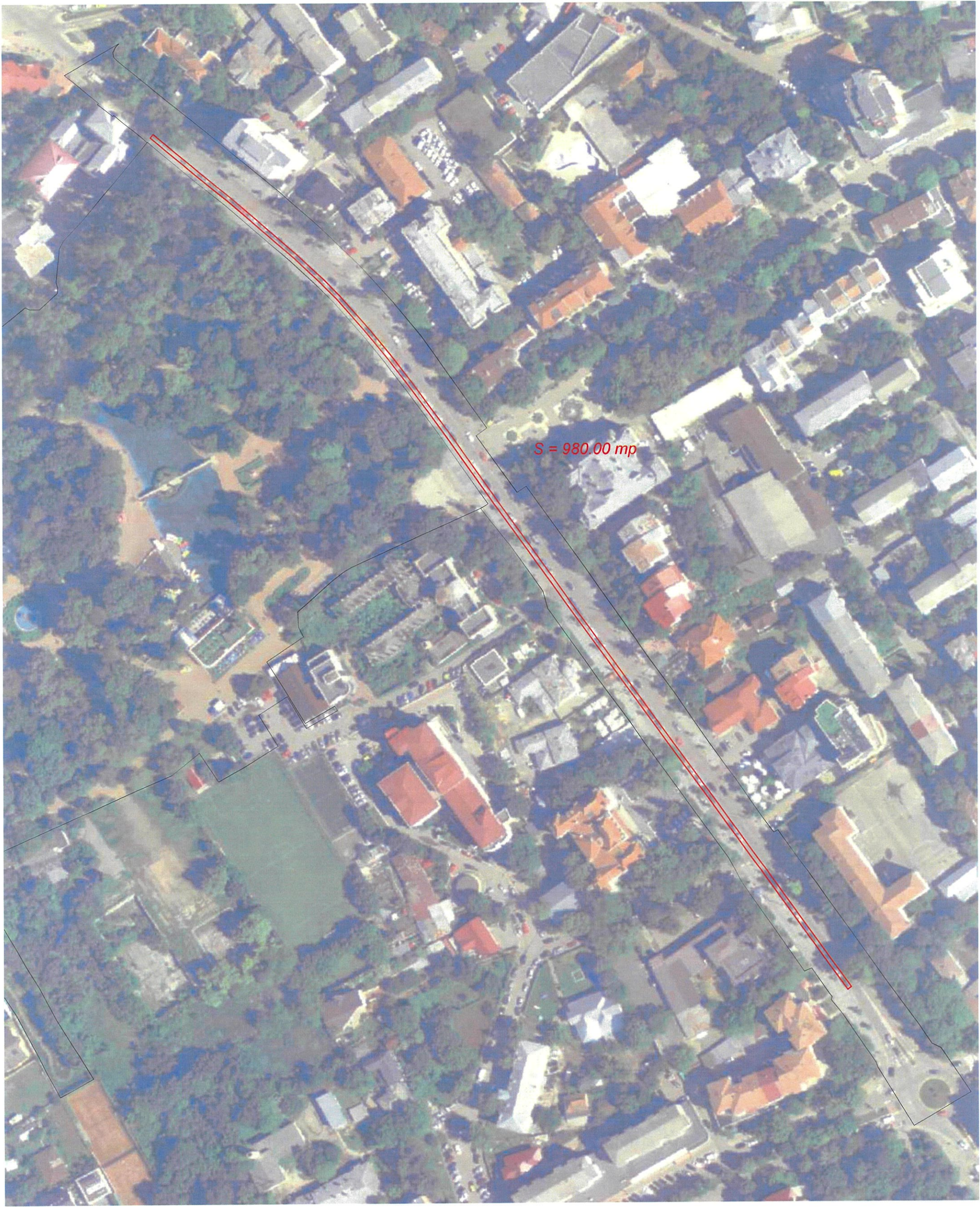
BLVA MIHAI EMINESCU