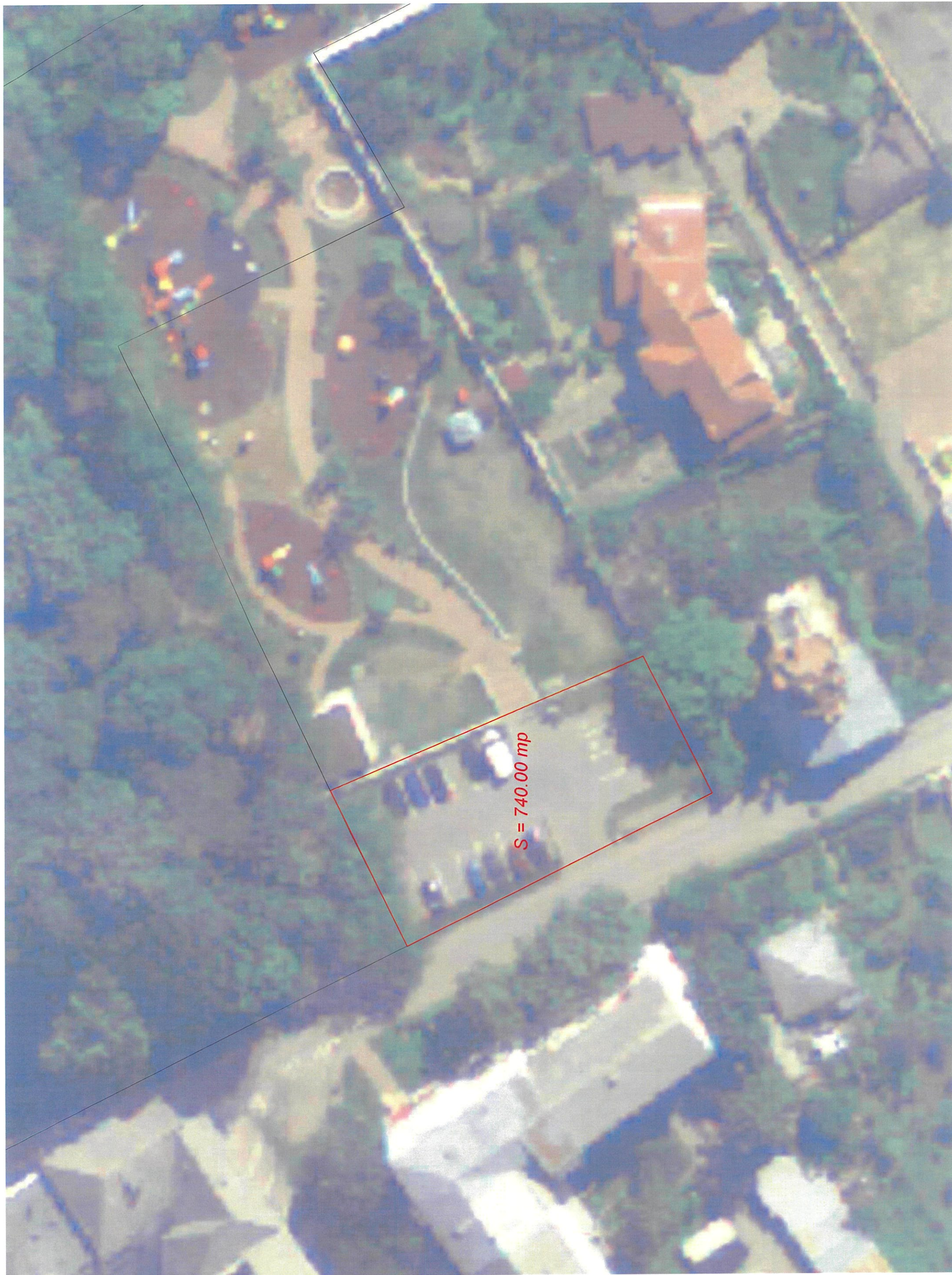
VĂRNAY - 31 ATIU JOACO