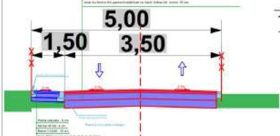
PROFIL TRANSVERSAL MENȚINUT cf. AC nr.39/2017