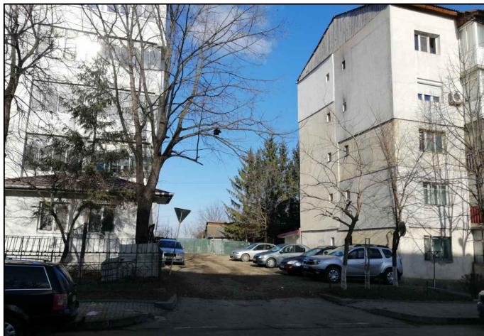
ACCES SPRE PROPRIETATE DIN STR. ÎMPĂRAT TRAIAN