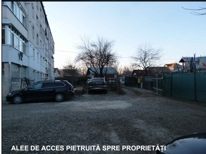
ALÉE DE ACCES PIETRUITĂ SPRE PROPRIETĂȚI