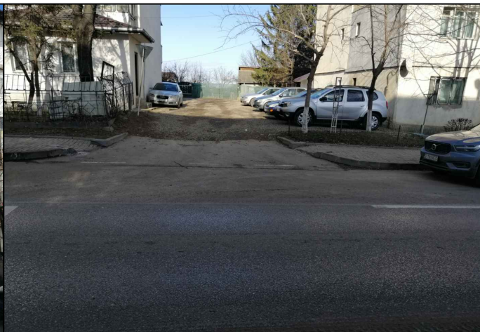
ACCES SPRE PROPRIETATE DIN STR. ÎMPĂRAT TRAIAN