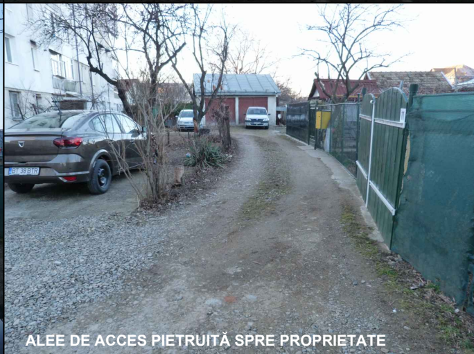
ALÉE DE ACCES PIETRUITĂ SPRE PROPRIETATE