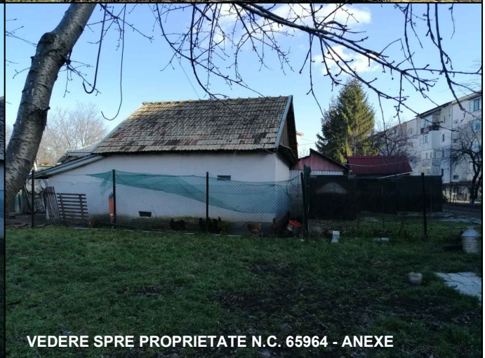
VEDERE SPRE PROPRIETATE N.C. 65964 - ANEXE