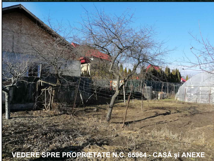
VEDERE SPRE PROPRIETATE N.C. 65964 - CASĂ și ANEXE