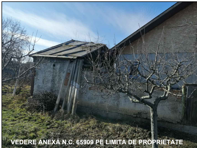
VEDERE ANEXĂ N.C. 65909 PE LIMITA DE PROPRIETATE