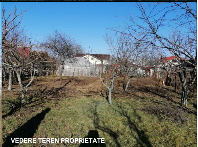
VEDERE TEREN PROPRIETATE