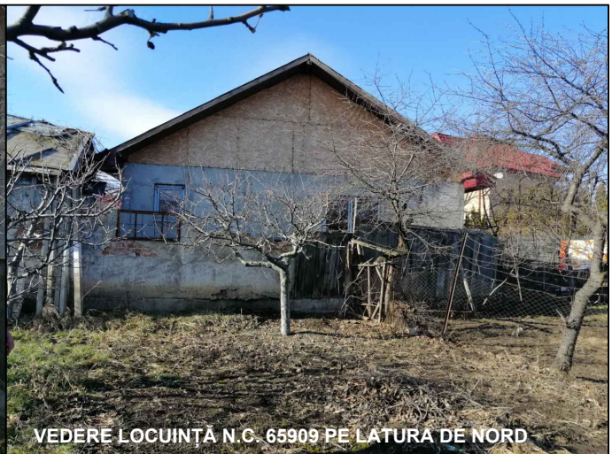
VEDERE LOCUINȚĂ N.C. 65909 PE LATURA DE NORD