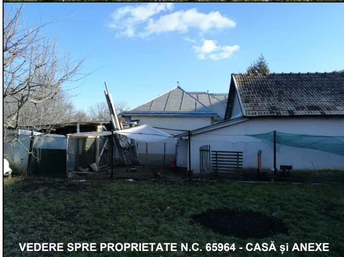
VEDERE SPRE PROPRIETATE N.C. 65964 - CASĂ și ANEXE