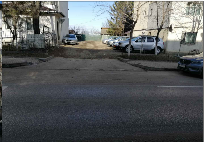
ACCES SPRE PROPRIETATE DIN STR. ÎMPĂRAT TRAIAN