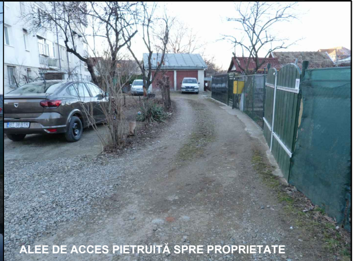
ALEE DE ACCES PIETRUITĂ SPRE PROPRIETATE