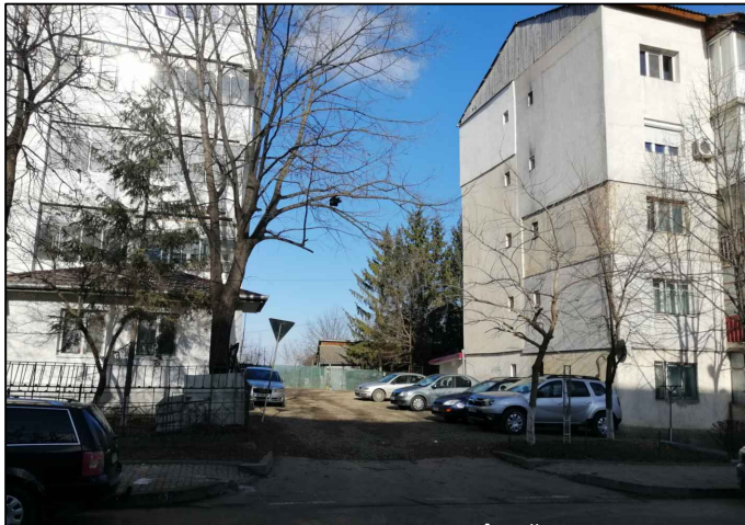
ACCES SPRE PROPRIETATE DIN STR. ÎMPĂRAT TRAIAN