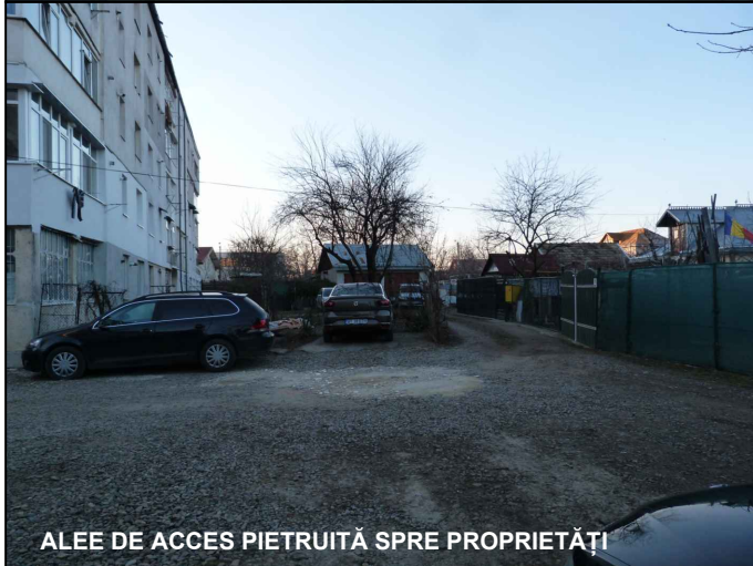
ALEE DE ACCES PIETRUITĂ SPRE PROPRIETĂȚI