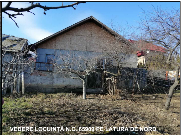
VEDERE LOCUINȚĂ N.C. 65909 PE LATURA DE NORD