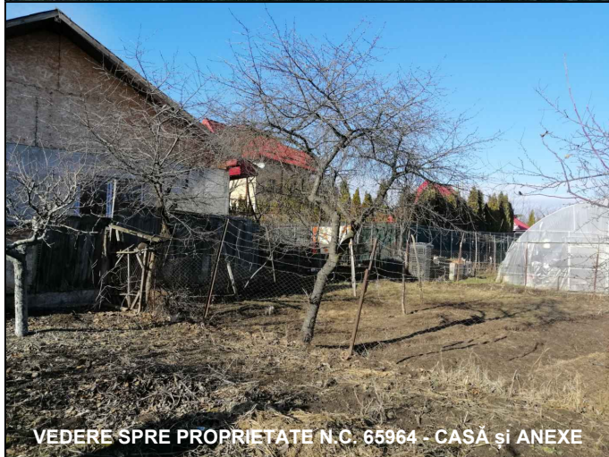
VEDERE SPRE PROPRIETATE N.C. 65964 - CASĂ și ANEXE