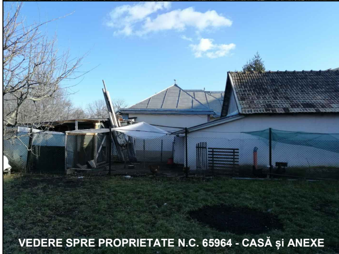
VEDERE SPRE PROPRIETATE N.C. 65964 - CASĂ și ANEXE