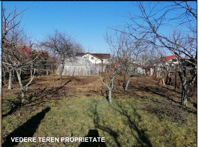
VEDERE TEREN PROPRIETATE