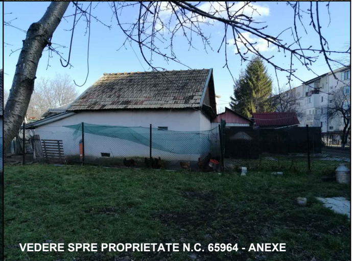
VEDERE SPRE PROPRIETATE N.C. 65964 - ANEXE