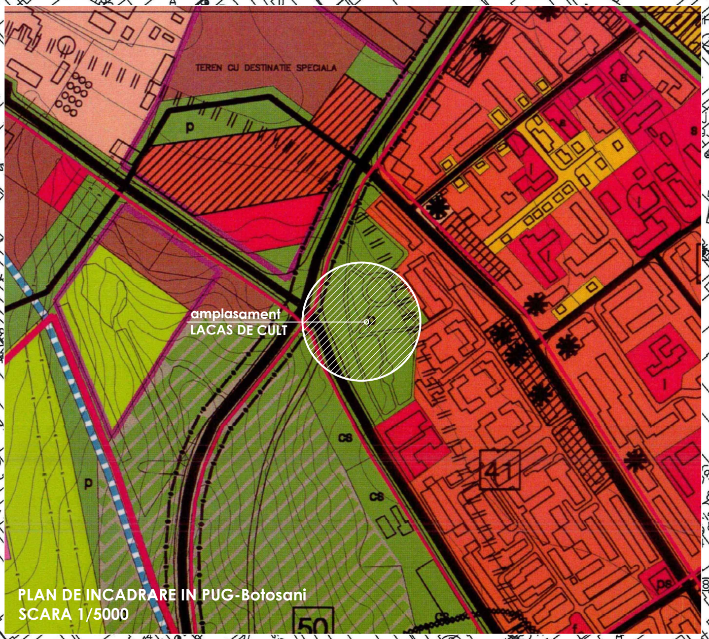
PLAN DE INCADRARE IN PUG-Botoșani SCARA 1/5000