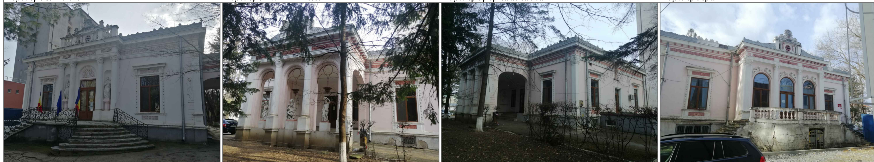
CASA SOFIAN ARAPU - azi COLEGIUL MEDICILOR DIN BOTOȘANI Fațada spre Str. Marchian Fațada spre B-dul. M. Eminescu Fațada spre proprietatea studiată Fațada spre spital