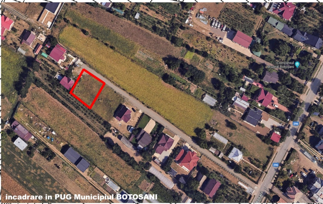
incadrare in PUG Municipiul BOTOSANI

str. DOBOSARI nr. 57 C UTR nr. 20, CAD 70950 / UAT BOTOSANI teren 706 mp / arabil