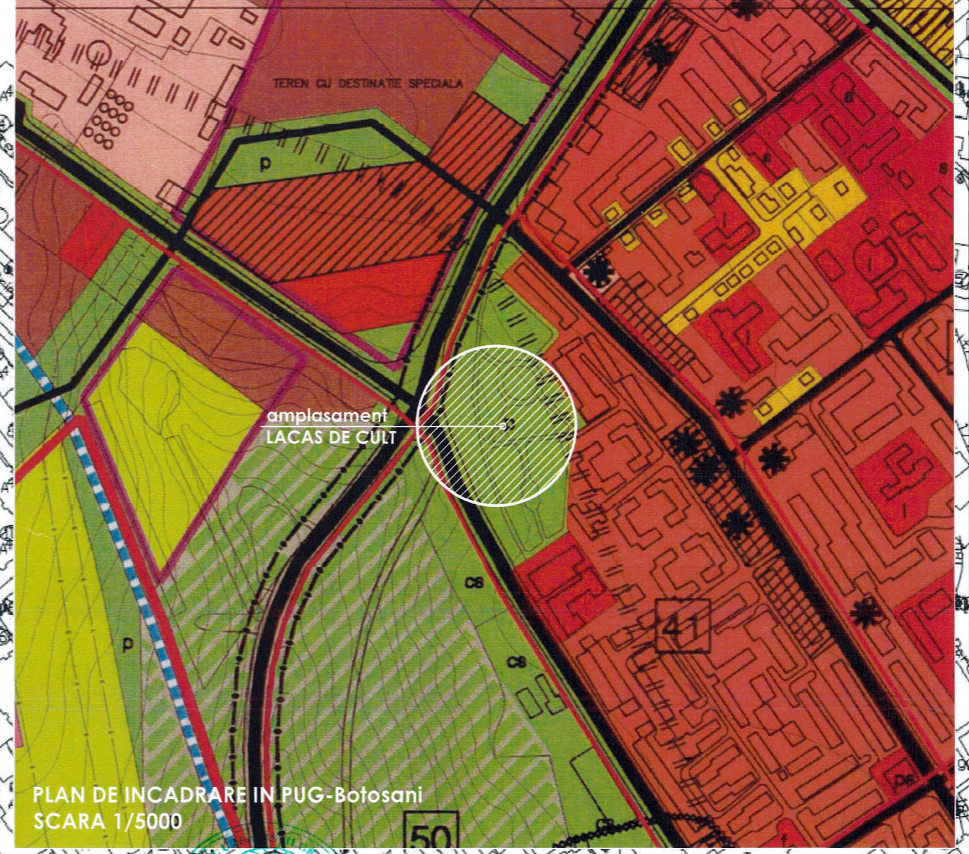
PLAN DE INCADRARE IN PUG-Botosani SCARA 1/5000