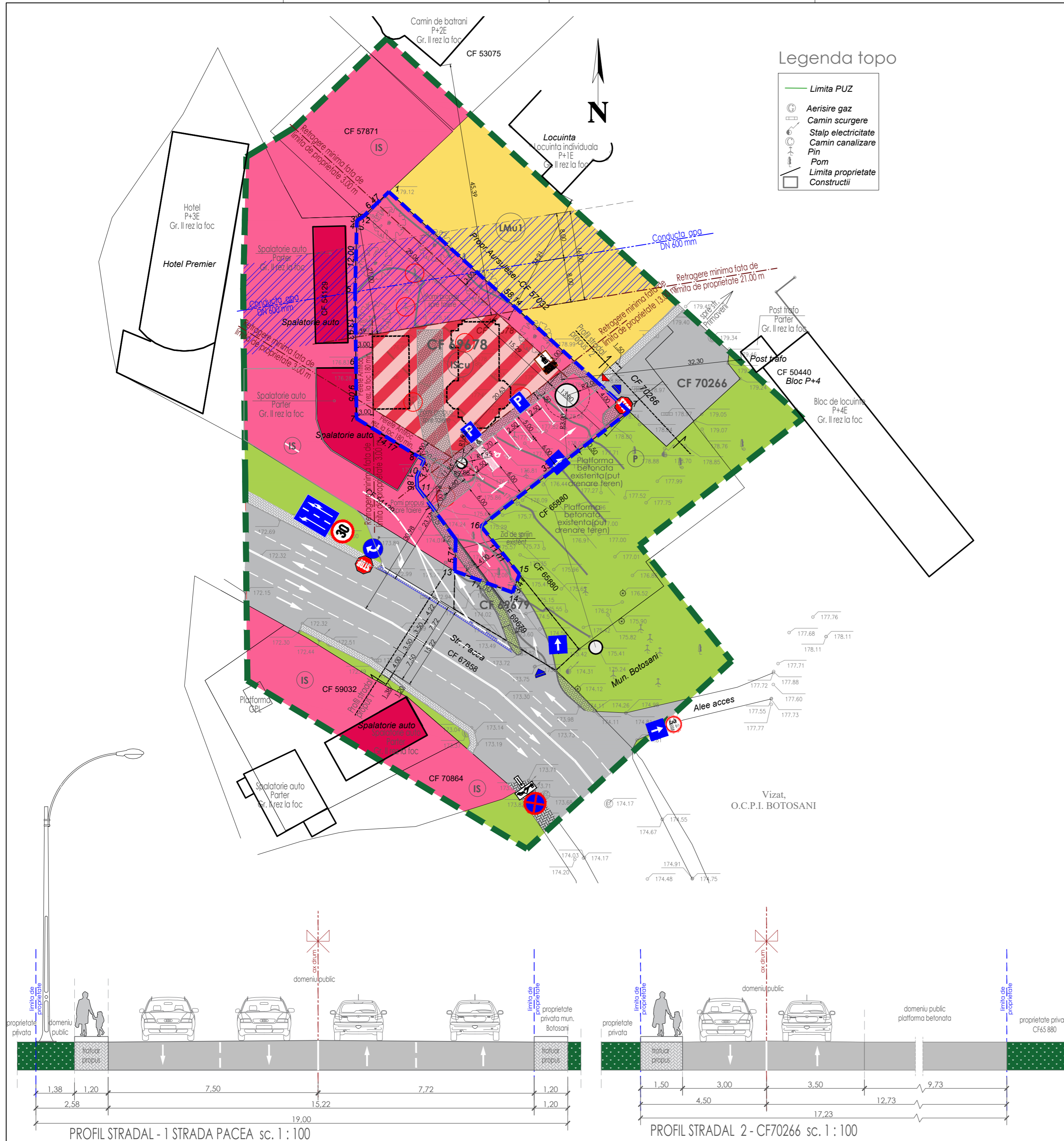
PROFIL STRADAL - 1 STRADA PACEA sc. 1 : 100