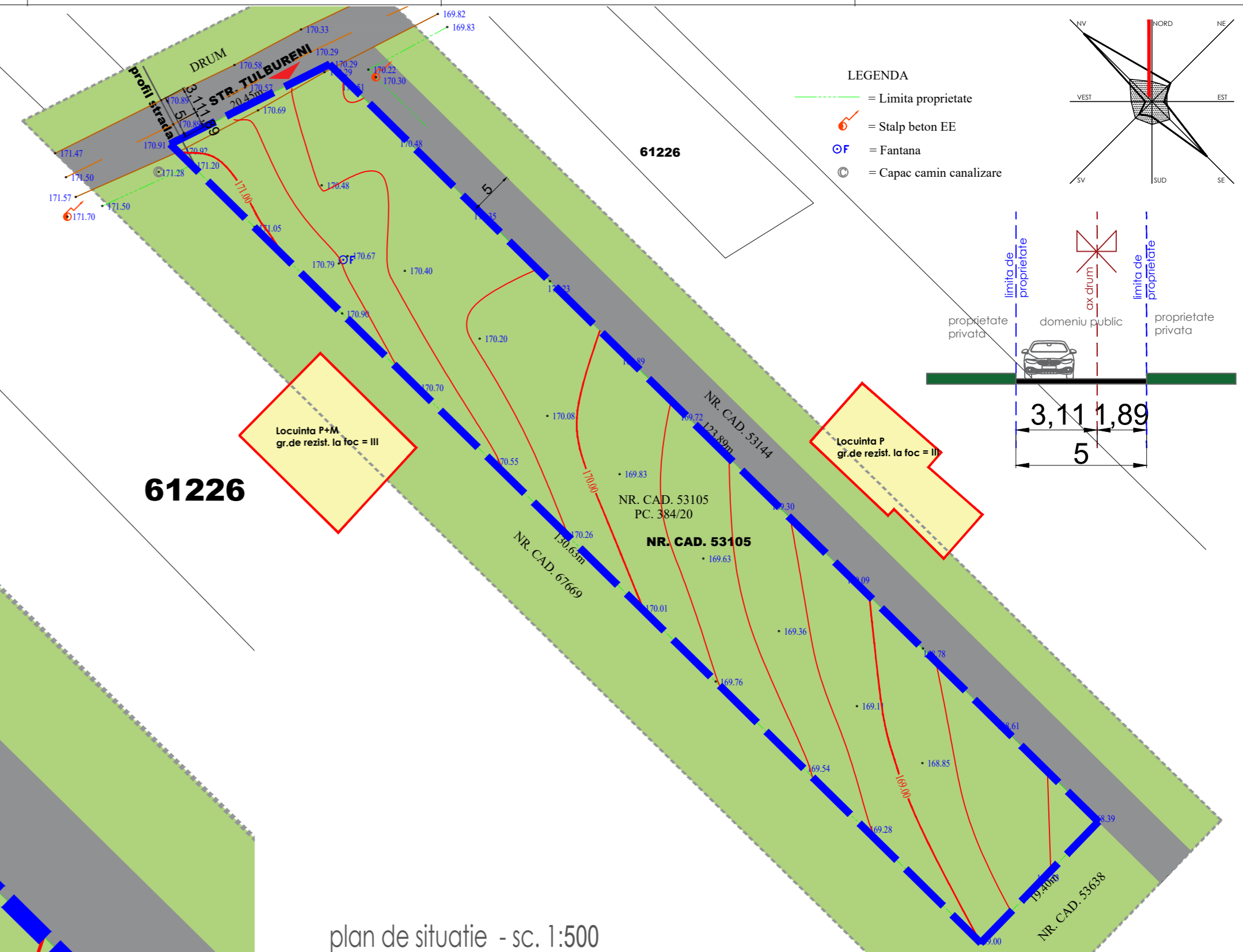
plan de situatie - sc. 1:500