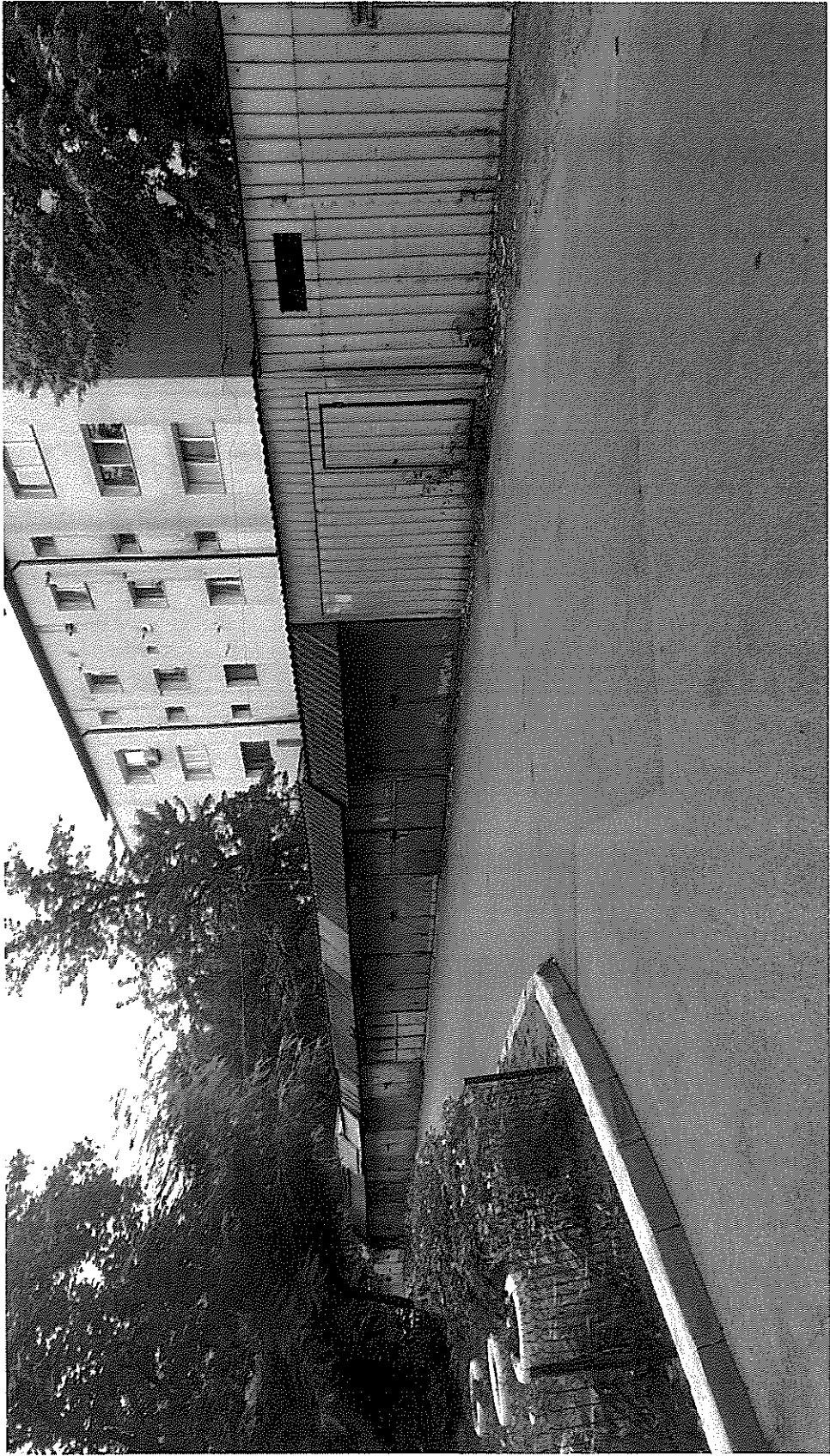
BATERIE GARAJE - 1