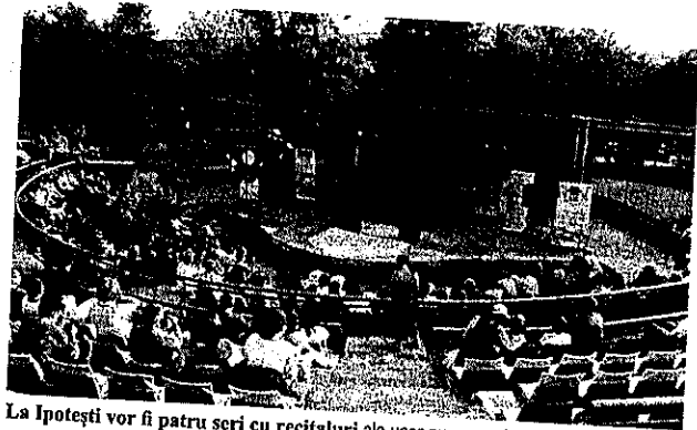
La Ipotești vor fi patru seri cu recitaluri ale unor nume mari ale muzicii românești

F estivalul Național de Muzică „Seri Melancolice Emi-