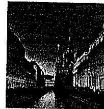
Imagine din timpul Festivalului contemporan al „Noptilor Albe” de la Sankt Petersburg

și câinele în grădina de la Tarkoc Selo. În timpul domniei sale au devenit celebre „Noptile albe” de la Sankt Petersburg