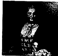
Marie-Anne de Vichy de Chamrond, Marquise du Deffand (1697 - 1780), cea de la care avem prima atestare a expresiei „noapte albă”

marchiza du Deffand, în scrierile sale către Walpole. În spațiul românesc, expresia e posibil să fi pătruns în același secol XVIII, în contextul războaielor ruso-turce din cadrul „Problemei Orientale”. Ofițerii ruși, vorbitori de franceză, au răspândit-o în saloanele epocii de la București și Iași, românii preluându-o și folosind-o până astăzi.