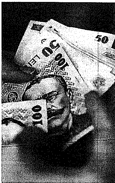
Bursa de merit va avea o valoare mai mult decât dublă și va fi primită de mai mulți elevi

Elevii români au început școala săptămâna trecută, pe