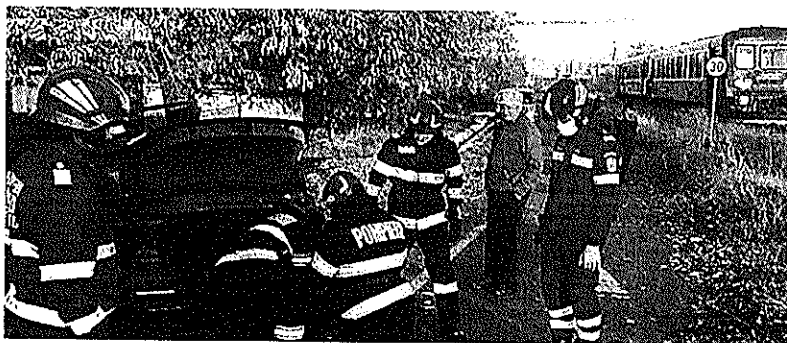
Șoferul grăbit a fost salvat de faptul că trenul nu circula cu viteză, dar și datorită robusteții mașinii

Un bărbat a ajuns la spital, după ce conducea a fost lovit în plin de un tren de călători. Accidentul s-a produs ieri pe strada Colonel Vasiliu, la o trecere peste calea ferată, mașina fiind însă lovită în plin de trenul personal.