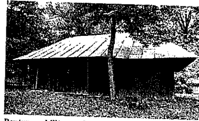
Pentru reabilitare a fost propusă și Biserica călătore din Dobrinăuți-Hapăi

Brăești, Biserica Aluniș (Ansamblul „Sfântul Nicolae” Vârful Câmpului, cunoscută ca Biserica pe roți din Dobrinăuți-Hapăi), Biserica „Schimbarea la față a Domnului” Schit-Orășeni și Ansamblul Bisericii „Adormirea Maicii Domnului” Hilișeu-Crișan. Fiecare dintre aceste șapte biserici de lemn va avea alocat în bugetul proiectului de promovare, care se va