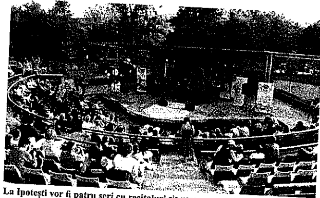
La Ipotești vor fi patru seri cu recitaluri ale unor nume mari ale muzicii românești

F estivalul Național de Muzică „Seri Melancolice Emi-